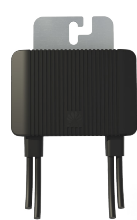
Smart PV Optimizer