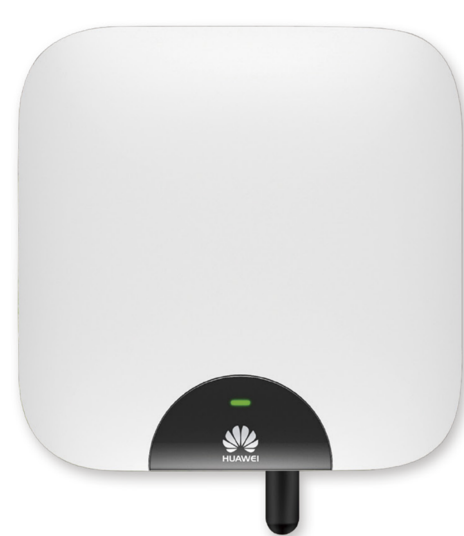
Smart Energy Center

* Le funzioni contrassegnate da * * * richiedono Smart PV Safety Box e la versione completa di Smart PV Optimizer